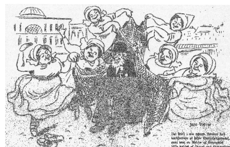
Tegningen af mødet med fiskekonerne på Gl. Strand blev bragt i det satiriske blad Klods Hans den 1. august 1913