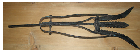
Et ålejern