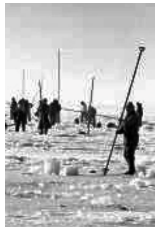
Ålestangning på Limfjorden