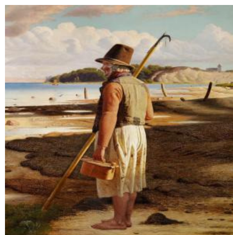
En gammel Fisker paa Stranden ved Limfjorden Maleri af Christen Dalsgaard 1871