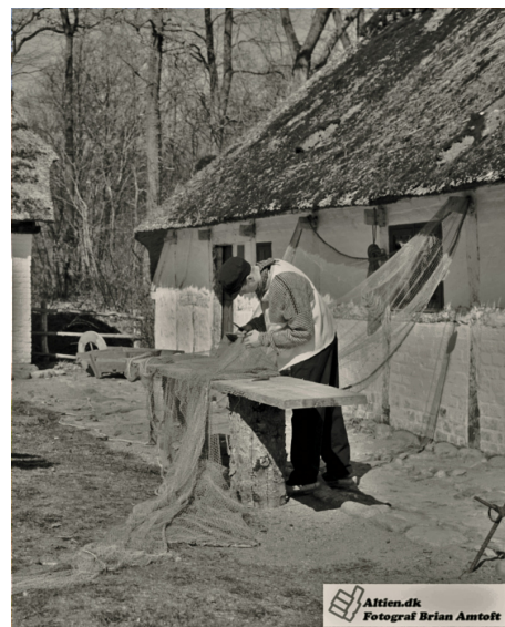
Jens reparerer net. Foto fra filmoptagelsen.

Mængden af tov i båden fortæller dem, at de snart skal hale