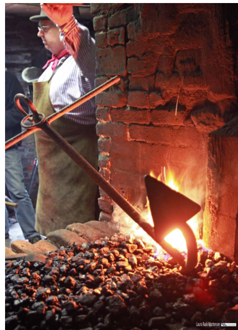
Smeden fremstiller det nye anker. Billede fra filmoptagelsen efterår 2011.