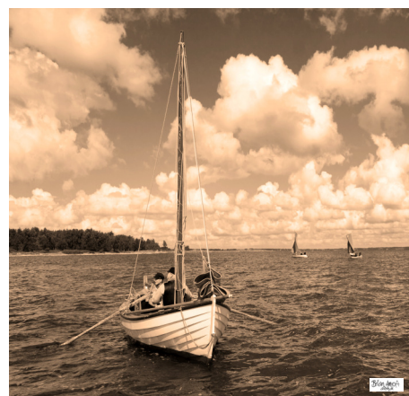
På fiskeri med snurrevod. Billede fra filmoptagelsen. August 2011