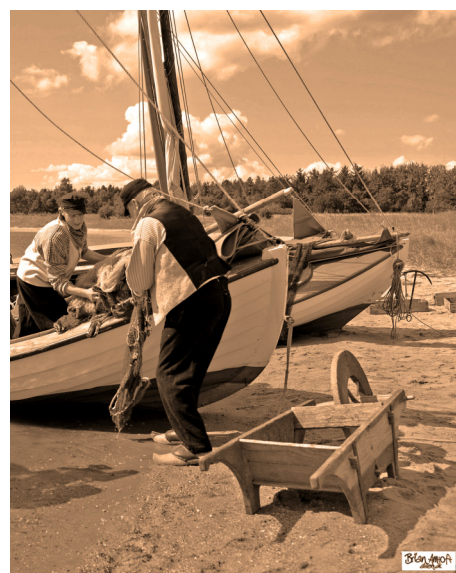
Grejet læses på båden. Billede fra filmoptagelsen. August 2011