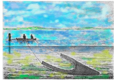
Fiskeri med pælevod Bearbejdelse af tegning: Finn W. Mosegaard

De kan bare ikke nå herud med deres landdragningsvod.