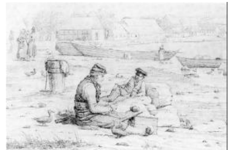
Fiskere på stranden ved Thisted