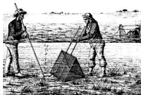
To mænd gliber i Limfjorden Samtidig tegning