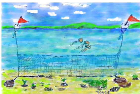
Nedgarn til bundfiskeri. Tegning: Finn W. Mosegaard